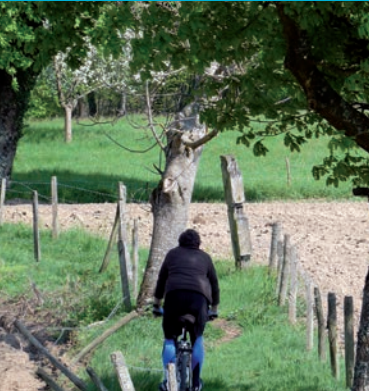
Chemin aux Boissières. C.Maurel