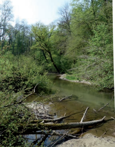
La rivière Thiers. C.Maurel