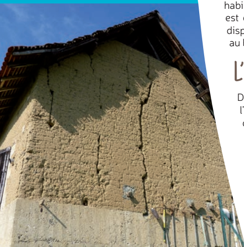
Une architecture en béton de terre, le Pisé. C.Maurel